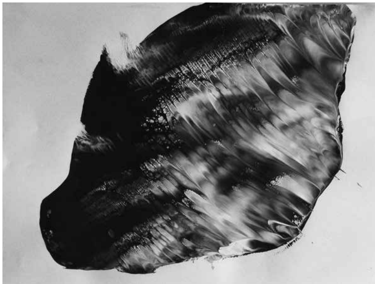
Abb. 6: «Der Körper im Wandel» (Stempeltechnik 20 x 30 cm). In dieser Arbeit stellt Francesco die Adoleszenzphase dar. Schwarz und Weiss stehen für die typische adolescente Unausgewogenheit.

Das kreative Schaffen und das selbst angefertigte Bild resp. (Kunst-)Werk konnten bei diesem Jugendlichen – wenigstens situativ – die häufig stimmungsaufhellend wirkenden Süßigkeiten ersetzen, indem sie Freude und neuen Schwung vermittelten. Kunsttherapie kann somit gewissermassen auch als eine Art «Antidepressivum» fungieren und, wenn auch nur kurzzeitig, den Drang zur Nahrungsaufnahme verringern. Einige der zentralen Themen des Jugendlichen kamen durch den gestalterischen Prozess an die Oberfläche und ermöglichten Zielsetzungen für die weitere therapeutische Arbeit und persönliche Auseinandersetzung.